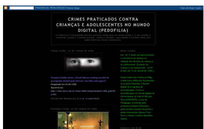
Figura 3. Blog do projeto “Pedofilia no Mundo Digital” http://fezynhareis.blogspot.com