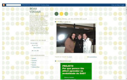
Figura 1. Blog do projeto “Por que parece tão difícil aprender na modalidade EAD?” http://projetoead2008.blogspot.com

Por meio da criação de blogs, os projetos de aprendizagem baseados em problemas vão se constituindo, vão sendo desenhados, adquirindo contornos, e sendo divulgadas durante o semestre, evidenciando o processo em construção. Os blogs possibilitam ao professor e aos alunos ter acesso a todo o processo que está sendo desenvolvido, criando uma rede de trabalho, de colaboração e de cooperação efetiva em torno das diferentes problemáticas que integram a temática da “Educação Digital”. A seguir, são apresentados alguns exemplos de Blogs construídos pelos alunos do PA, durante o primeiro semestre do ano de 2008.